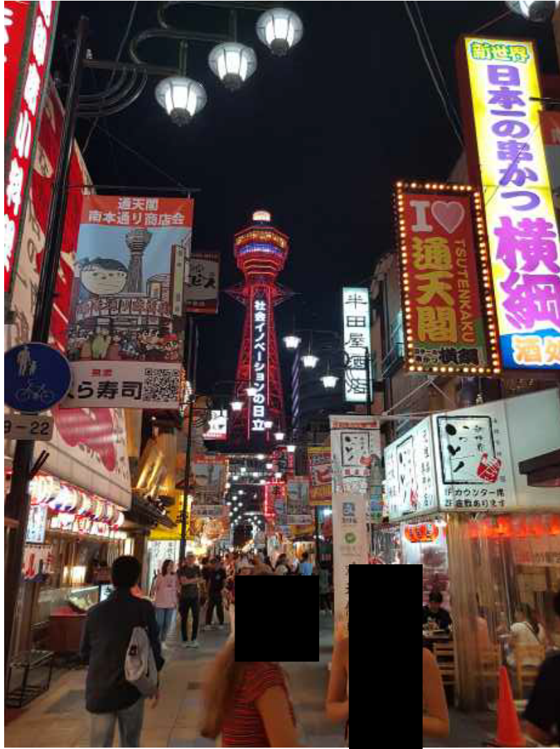
Abb.1 Osaka bei Nacht

Die Kansai University befindet sich in der Stadt Suita, in der Präfektur Osaka, zu welcher auch die Stadt Osaka gehört. Suita ist etwa 30 Minuten mit der Bahn vom Stadtzentrum entfernt, wobei es bei der immensen Größe der Stadt schwierig ist einen Ort als Stadtzentrum zu benennen. Die Region um Osaka ist nach der Metropolregion Tokio die zweitgrößte des Landes. Angrenzend an Osaka liegen im Osten und Westen die Millionenstädte Nara und Kobe. Etwa 70 Kilometer nördlich von Osaka liegt die kulturell sehr bedeutsame ehemalige Hauptstadt des Landes Kyoto.