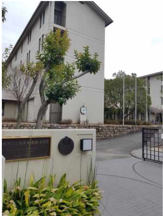
Abb.6 Das Shurei-Ryo Wohnheim von der Hauptauffahrt

Austauschstudierende, welche nicht im Shurei Ryo unterkamen, waren zum Großteil im gemischtgeschlechtlichen Kansai University International Dormitory untergebracht. Hier haben alle Bewohner ein Einzelzimmer, aber man braucht circa 30 Minuten mit der Bahn zur Uni. Insgesamt bin ich daher sehr zufrieden mit dem Shurei-Ryo. Auch der Preis von knapp 300€ pro Monat ist außerhalb der universitären Studentenwohnheime in der Gegend kaum zu erreichen.