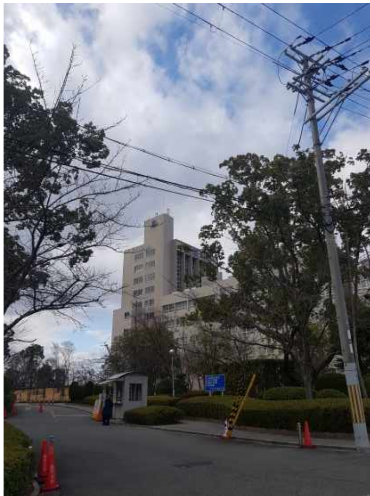
Abb.2 Das Hauptgebäude der Kansai University

Die Kansai University ist eine 1886 gegründete Privatumi. Ursprünglich wurde die Universität als Rechtsschule gegründet, heute bietet sie in 13 Fakultäten eine breite Auswahl an Abschlüssen an. Die Uni hat etwa 30.000 Studierende. Das internationale Programm der Uni - Kansai University Global Frontier - besteht aus einer Vielzahl an Schlüsselkompetenzmodulen für alle Fakultäten in englischer Sprache. Japanische Studierende belegen diese als Schlüsselkompetenzen. Das Angebot ist in der Breite mit dem der ZESS in Göttingen vergleichbar, wenngleich die ZESS in der Tiefe etwas mehr zu bieten hat. Die Studieninhalte außerhalb von KUGF finden allesamt auf Japanisch statt, und sind für Austauschstudenten nur in Ausnahmefällen zugänglich. In den meisten Kursen, mit Ausnahme der Japanischkurse, waren etwa 6 von 25 Studierenden nicht-Japaner.