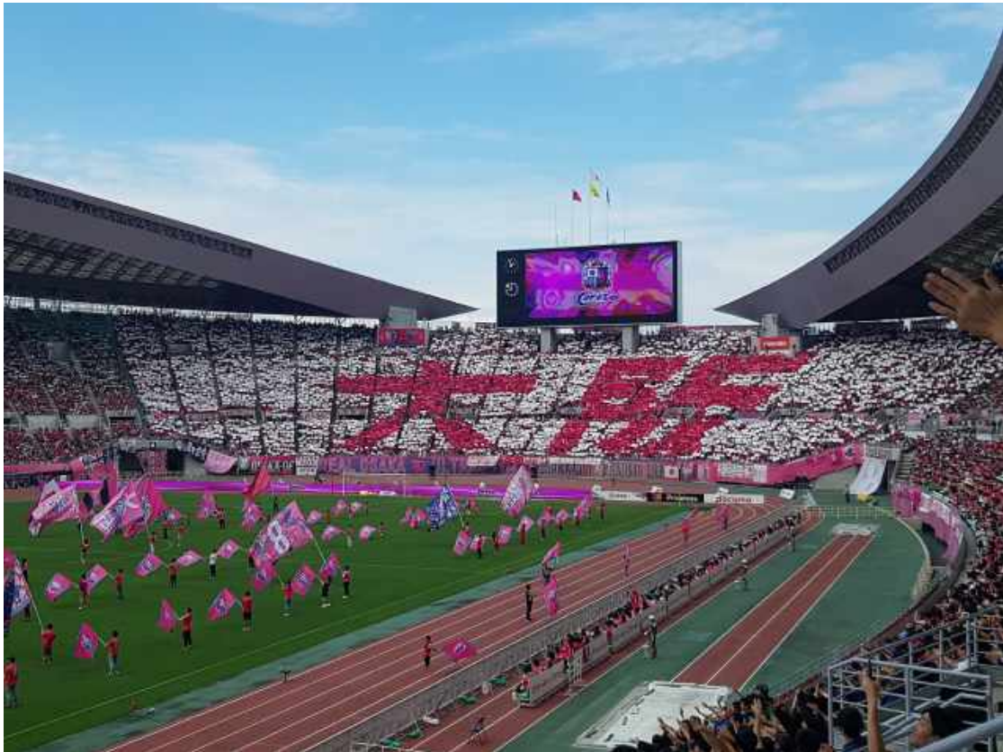
Das Stadtderby zwischen Cerezo Osaka und Gamba Osaka