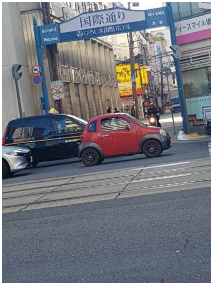
Abb.7 Japanischer Minimalismus

Mein Fazit könnte nicht anders als positiv ausfallen. Ich wollte ursprünglich zwei Semester dort verbringen, habe meine Zeit dort aber auf ein Semester verkürzt, hauptsächlich wegen der geringen Anforderungen der Kurse. Dies ist aber auch mein einziger Kritikpunkt. Das Wohnen im Studentenwohnheim hat großen Spaß gemacht, Osaka und Japan allgemein sind geographisch sehr reizvolle Gegenden und die Höflichkeit der Japaner habe ich ab der ersten Minute außerhalb des Landes schon vermisst. Auch dass meine Erwartungen an die Englischfähigkeiten der Japaner nicht erfüllt wurden, war keine Hürde. Bereits nach kurzer Zeit war ich in der Lage mit einer Mischung aus Englisch, Japanisch und Gesten mich verständlich zu machen. Auch das macht besonders im Erfolgsfall großen Spaß. Insgesamt hat mich mein Auslandssemester fachlich nicht so gefordert wie ich gehofft hatte, es hat mich aber vor allem menschlich sehr bereichert.