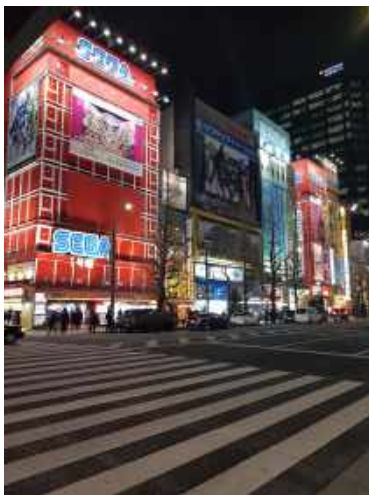
Abb.5 Akihabara - 'The electric town'

Anfang Dezember bin ich mit fünf meiner Kommilitonen für ein langes Wochenende nach Seoul geflogen. Seoul hat mich in vielen Aspekten begeistert. Insgesamt würde ich sagen, dass es die modernste Großstadt ist, die bisher besucht habe. Das Nahverkehrssystem ist erstklassig, es wird großen Wert auf Englisch gelegt und die Digitalisierung ist überall spürbar. Bemerkenswert ist, dass die bei uns eher abstrakte Bedrohung durch Nordkorea hier viel präsenter ist. Rettungswege für den Fall eines Bombenangriffs sind in vielen Gebäuden vorhanden und die großen Stationen der U-Bahnen sind als behelfsmäßige Bunker ausgewiesen.