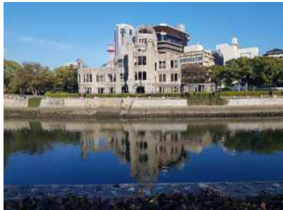
Abb.4 Die berühmte 'Atombombenkuppel' in Hiroshima

Nach Ende der Vorlesungszeit bin ich Ende Januar mit dem Shinkansen nach Tokio gefahren, von wo aus ich nach Hause geflogen bin. Eigentlich ist Tokio über die Jahre aus vielen kleineren Städten zusammengewachsen und so kommen die einzelnen Stadtteile teilweise sehr unterschiedlich daher. Daher hat die größte Stadt der Welt für jeden Geschmack etwas zu bieten. Die eindrucksvollsten Stadtteile waren für mich Akihabara - ein ganzes Stadtviertel, welches Sammelkarten und Mangas gewidmet ist - und Asakusa, wo sich der Sensō-ji , der älteste buddhistische Tempel Tokios befindet.