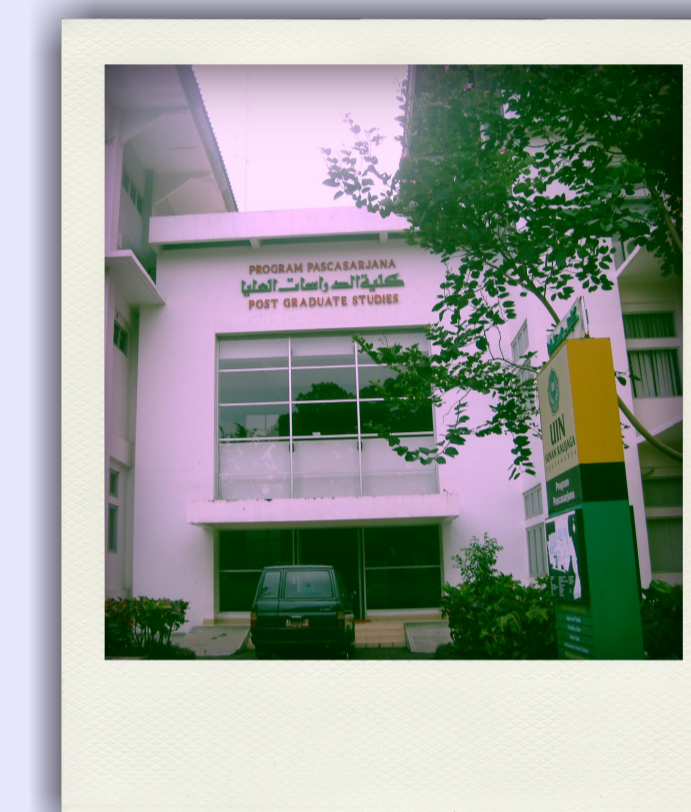
Vor der Campussmoschee