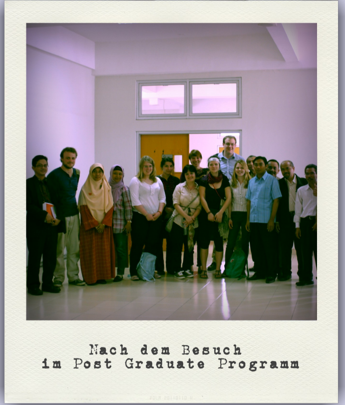
Nach dem Besuch im Post Graduate Programm