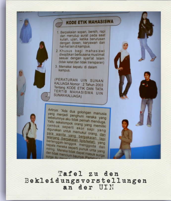
Tafel zu den Deklarationsvorstellungen an der UIN