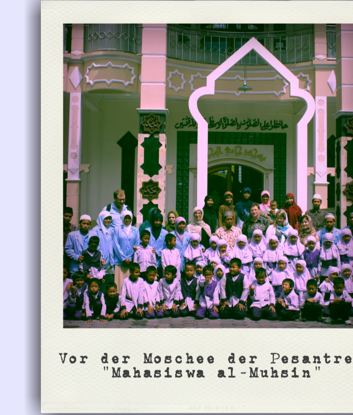
Vor der Moschee der Pesantren "Mahasisiwa al-Muhsin"