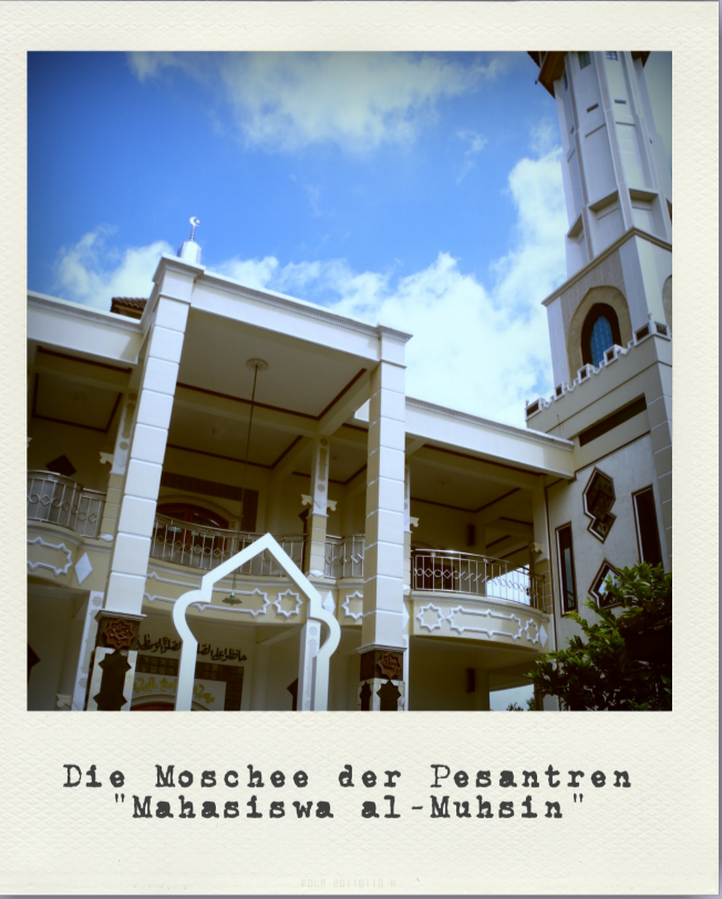
Die Moschee der Pesantren "Mahasisiwa al-Muhsin"