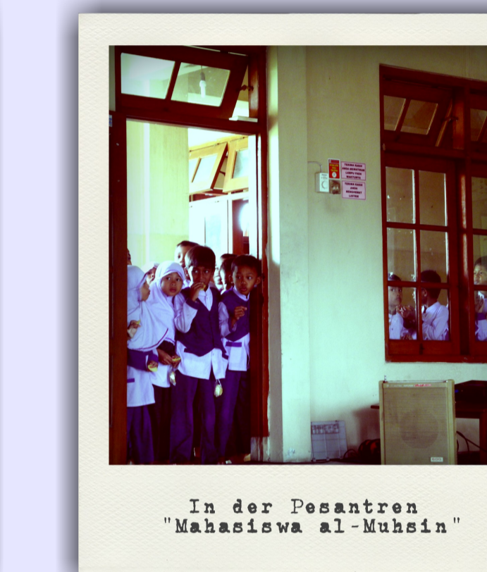
In der Pesantren "Mahasisiwa al-Muhsin"