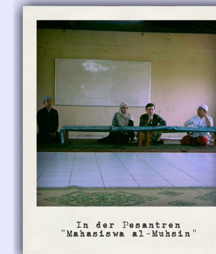
In der Pesantren "Mahasisiwa al-Muhsin"