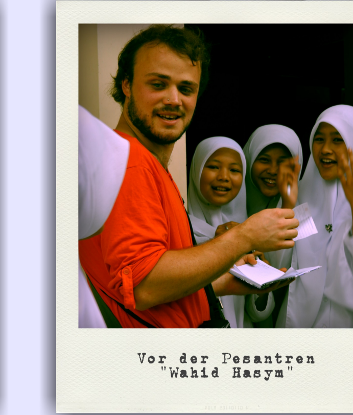
Vor der Pesantren "Wahid Hasyim"