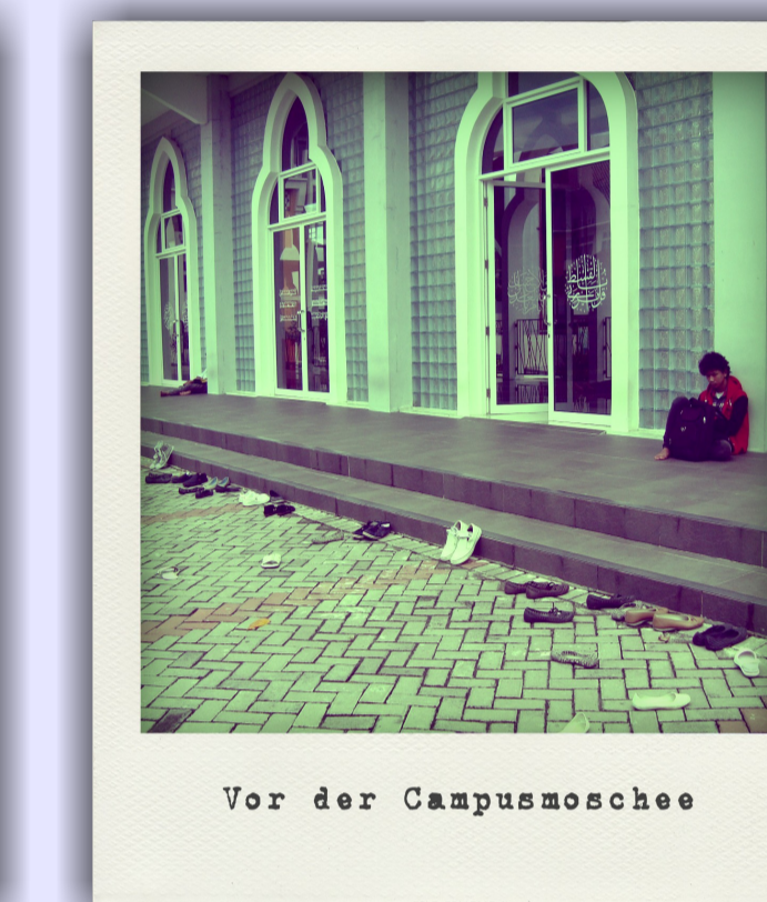
Vor der Campussmoschee