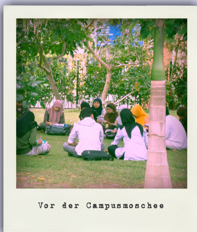
Vor der Campussmoschee