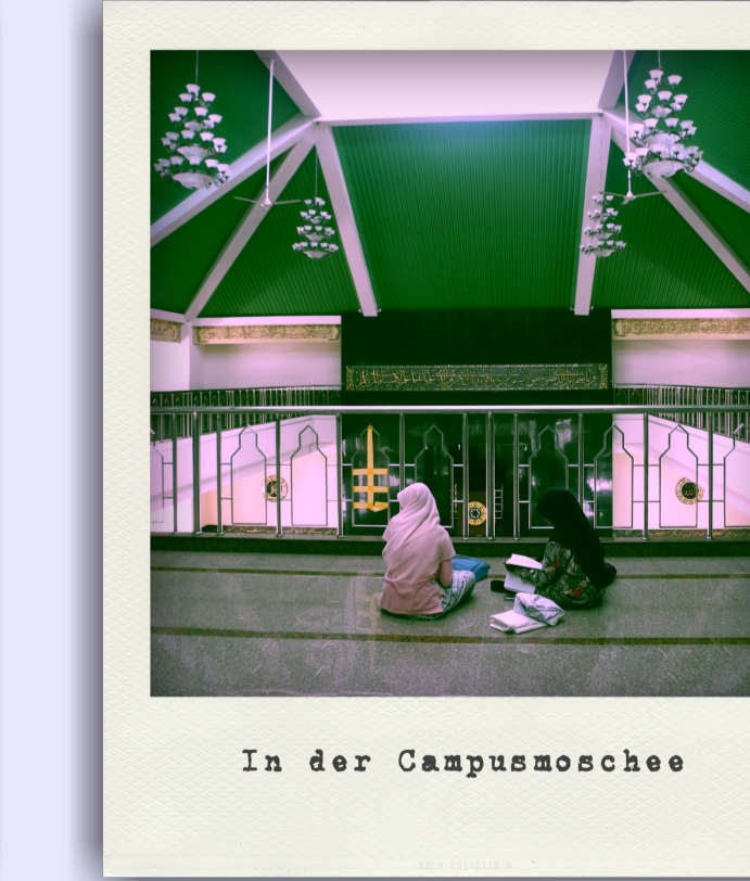
In der Campussmoschee